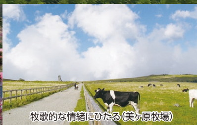
牧歌的な情緒にひたる(美ヶ原牧場)