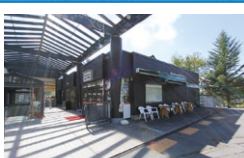
ヤマザキYショップ リゾートホテル 蓼科店