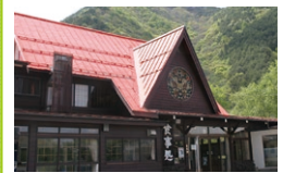
武石観光センター

☎ 8:30~17:00 休 月曜日(11月下旬~4月中旬) 7月下旬~8月末無休 ☎ 468 616 590*85