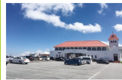
道の駅 美ヶ原高原