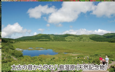
太古の昔から佇む八島湿原(天然記念物)