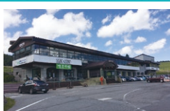
車山 ビジターセンター