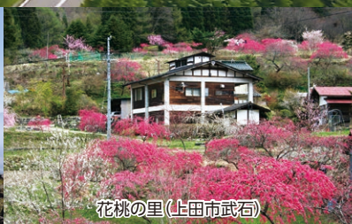
花桃の里(上田市武石)