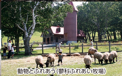
動物とふれあう(蓼科ふれあい牧場)