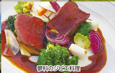
蓼科のジビエ料理

2エリア または 3エリア ※ 以上のスタンプを集めてアンケートにお答えいただくと、先着1,000名様に