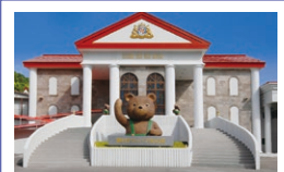
蓼科ティンバエ 美術館

☎ 9:00~17:00 休 11月25日~12月7日 ☎ 468 088 648*38