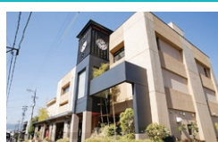
しもすわ昔館おいでや (時計工房儀象堂)