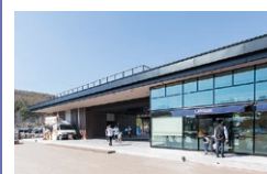
ローソン ビーナスライン白樺湖店