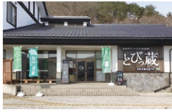
道の駅「マルメロの駅なごと」とびっ蔵

☎ 9:00~17:00 休 不定(団体貸切時)/10月下旬~ ☎ 468 205 893*58