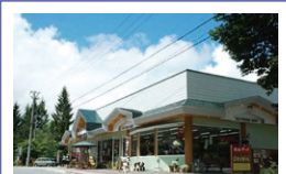
マンモス おみやげセンター

☎ 平日/10:00~15:00 休日/9:00~16:00 休 火曜日(冬季は無休) ☎ 816 031 206*73