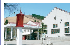
世界の影絵・きり絵 ガラス・オルゴール美術館

☎ 9:00~17:00 休 11月6日~3月31日 ☎ 468 059 848*40