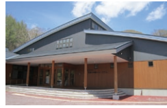
黒耀石 体験ミュージアム

☎ 9:00~17:00 休 月曜日 12月29日~1月3日 ☎ 85 361 369*52