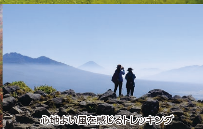
心地よい風を感じるトレッキング