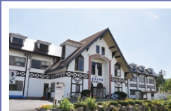
学習体験館 ルミエール

☎ 4~10月/9:00~18:00 11~3月/9:30~17:00 休 11月~3月の火曜日 ☎ 468 088 586*23