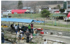
鷹山ファミリー牧場

☎ 9:00~17:00 休 不定(団体貸切時)/10月下旬~ ☎ 468 205 893*58