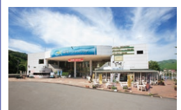
レイクサイド プラザ

☎ 9:00~17:00 休 11月6日~3月31日 ☎ 468 059 848*40