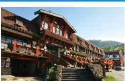
北ハケ岳 ロープウェイ駅舎

☎ 8:00~17:00(季節により運行時間が変わります) 休 11月中旬~12月上旬 ☎ 218 831 706*83