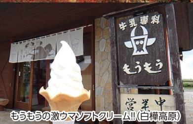
もうもうの激ウマソフトクリーム!!(白樺高原)