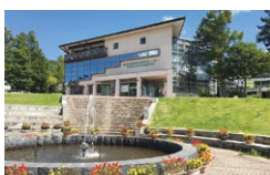
白樺高原 総合観光センター

☎ 8:30~17:00 休 4月・11~12月上旬の土日祝 ☎ 816 122 370*68