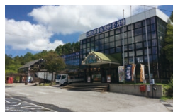
車山 スカイプラザ