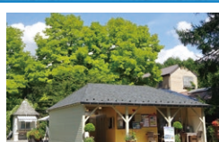
蓼科高原 パラクラ イングリッシュガーデン

☎ 8:00~17:00(季節により運行時間が変わります) 休 11月中旬~12月上旬 ☎ 218 831 706*83