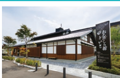
おんばしら館 よいさ