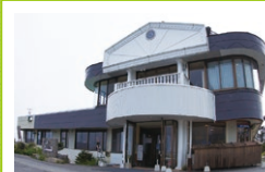
山本小屋 ふる里館

☎ 8:30~17:00 休 月曜日(11月下旬~4月中旬) 7月下旬~8月末無休 ☎ 468 616 590*85