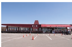
霧ヶ峰高原 ドライブイン 霧の駅