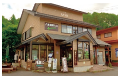
八島ビジターセンター あざみ館